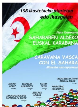
URATARRILAREN 23a arte

Martxan jarri da urtero legez tapoi bilketa SEUR Fundazioarekin batera. Ikastetxeko bi toki daude horretarako: Berrozpeko sekzioko ataria eta Administrazio Zikloko irakasle gelaren aurrea. Araian-arian hiru aldiz eraman dira SEUR Fundazioaren egoitzara pilatutako tapoiak.