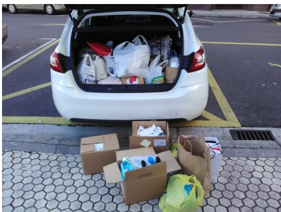
Berrozpeko sekzioan jasoak

Abenduan gobonetako janari bilketa egin ohi izan dugu herriko CARITASen alde. Aurten Gipuzkoako Caritas-ek bultzatutako kanpaina batek ordezkatu du: maskarak, garbikariak eta osasun produktuak jasotzea.