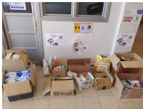
Erainkuntza nagusian jasoak

Pandemiak Gipuzkoako Odol Emailekin lan gehiago egiteko aukera eman digu. Urtero bezala, martxoaren 2an lehen aldiz odola emateko aukera emaneko helburuz etorri ziren ikastetxera. Hamazortzi urte bete berri dituzten ikasleei zuzentzen zaie deia, baina adin horretatik gorako pertsonak (ikasleak, ikastetxeko langileak ...) har dezakete parte. 27 pertsona baliatu zen aukeraz.